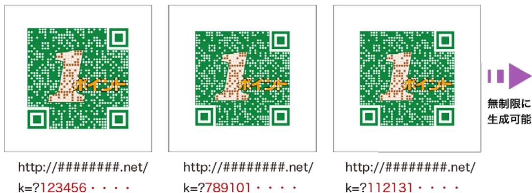
ロゴQメーカーによるロゴQ生成イメージ

当社が開発したロゴQ自動生成エンジン「ロゴQメーカー」は、見た目は同じデザインでも、コードのデータがそれぞれ異なるQRコードを、無制限かつ高速に生成することができます。